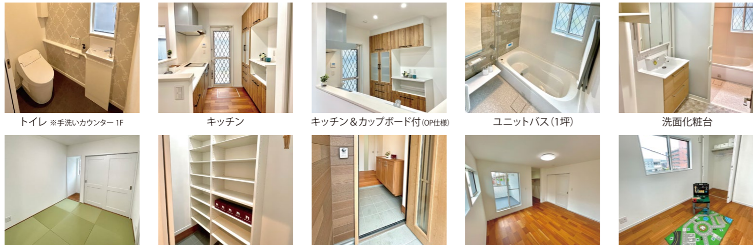
トイレ ※手洗いカウンター1F キッチン キッチン&カップボード付(OP仕様) ユニットバス(1坪) 洗面化粧台 シューズクローク ダイニングテーブル パントリー&カップボード付(OP仕様) LDK(18帖) ユニットバス(1坪) 和室(4.5帖) ※和紙畳(OP仕様) シューズクローク 玄関 寝室(8帖) 子供室(約5.3帖)