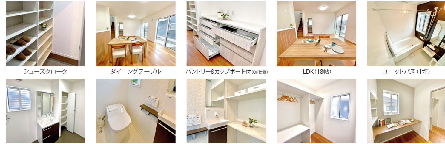
シューズクローク ダイニングテーブル パントリー&カップボード付(OP仕様) LDK(18帖) ユニットバス(1坪) 洗面所(3帖・W750) ※収納棚スペース付 トイレ(1F・1帖) ※食器用中性洗剤で汚れを除去 トイレ(1F) ※収納棚付 リビング収納(1F・2帖) ユーティリティ(1F・2帖) ※リモートワークスペース